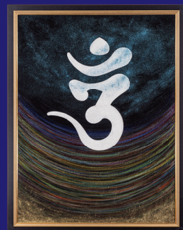
オン・大宇宙の聖なる音律 オンの旋律は一切を貫く オンの音律は、 実にこの一切 (宇宙) なり。