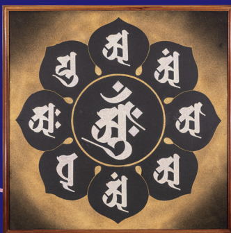
中台八葉院 (胎蔵界中央) 佛の慈悲が大宇宙の光となり、華麗な銀河となる。 無限の蒼願が煌めきとして 麗しき地球を輝かす。