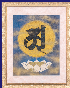
阿字観本尊 壮麗なる宇宙に光あり。 華麗な銀河となり。 麗しき地球となり。 人々の永遠の命の煌めきとなる。