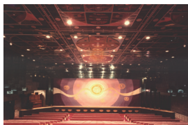
1982年 徳山暉純作 大阪・四天王寺大講堂緞帳壁画

※梵字とは：古代インドの文語である、梵語 (サンスクリット語) の「siddha (シッダン)」が母体となり、漢字では成就・吉祥を意味する「悉曇 (シツタン)」と訳され、悉曇文字とも言われています。