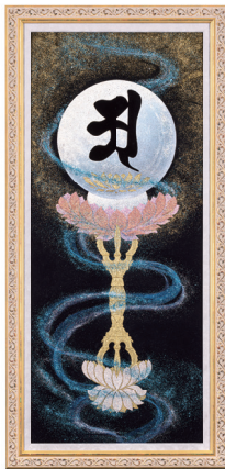
ア・文殊菩薩 (胎蔵界曼荼羅) 大宇宙の叡智で 人々を幸福に導く菩薩